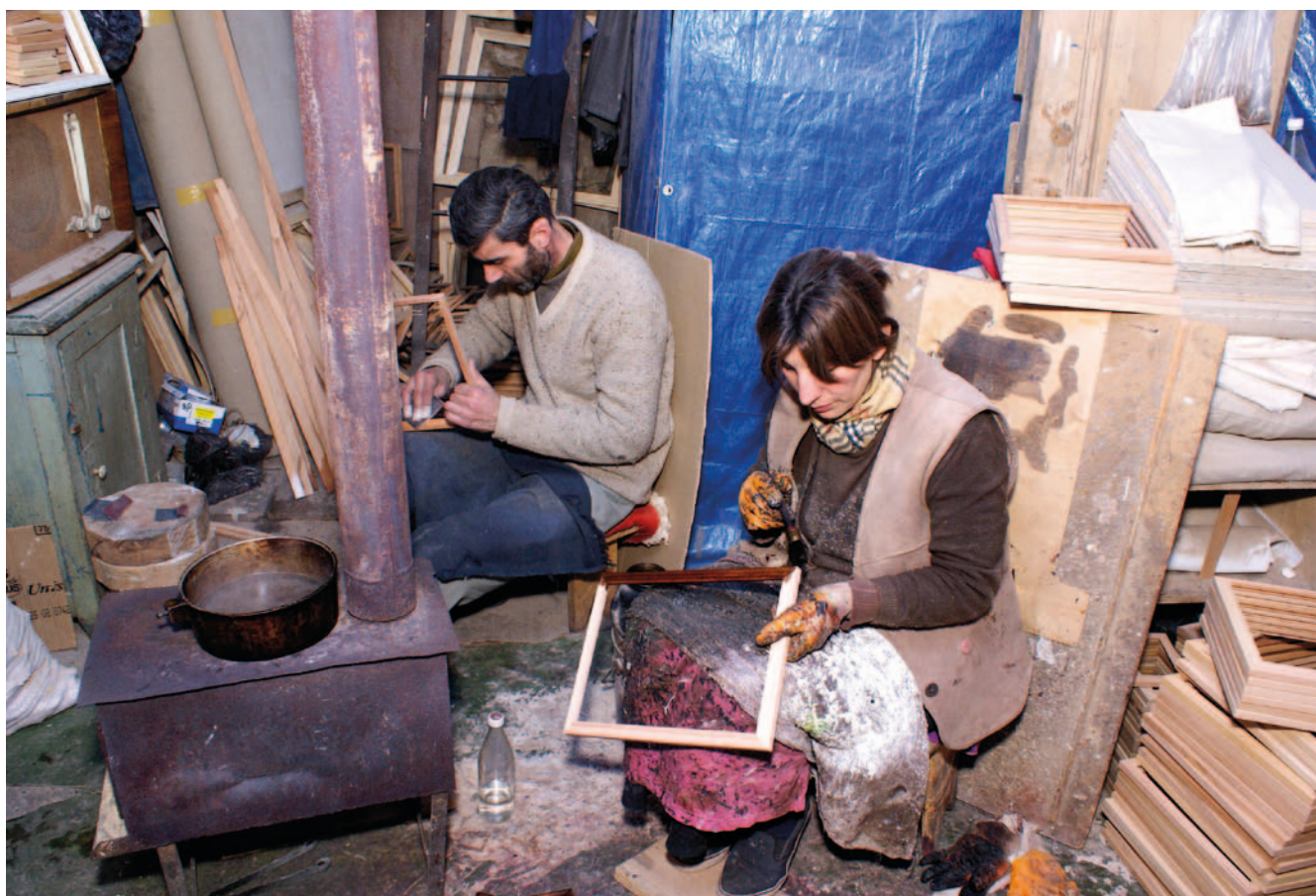
Taller de fabricación de marcos, Tbilisi, Georgia.

Zinnes, C. 2009 Business environment reforms and the informal economy , Cambridge, CDDE.