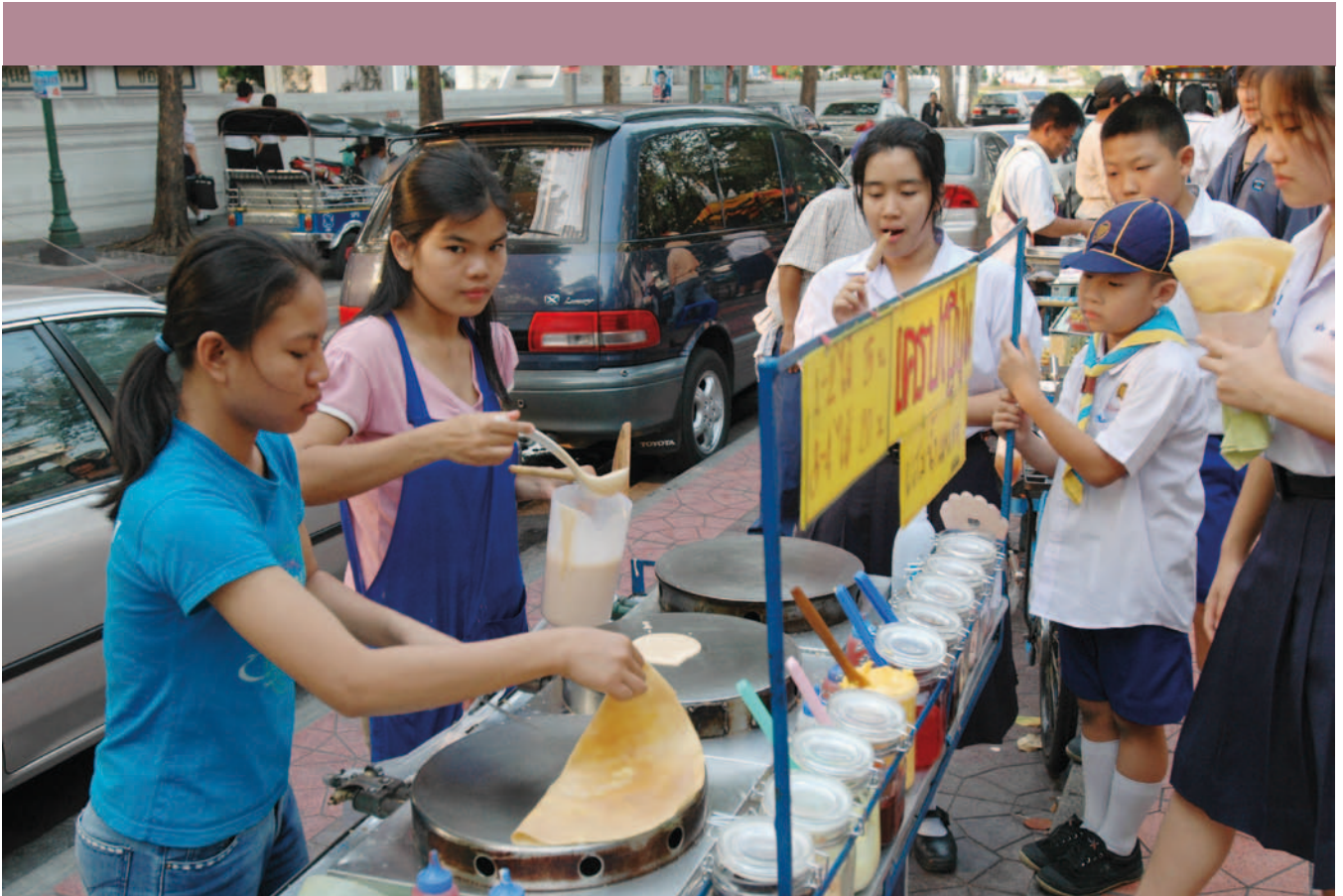
Puesto de venta de panqueques en una calle de Bangkok, Tailandia.

Oficina Internacional del Trabajo Ginebra