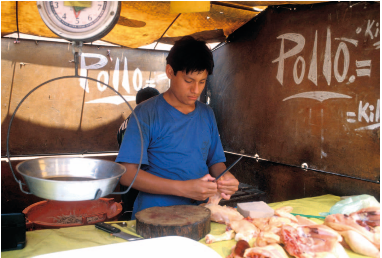
Puestero de mercado, Perú.