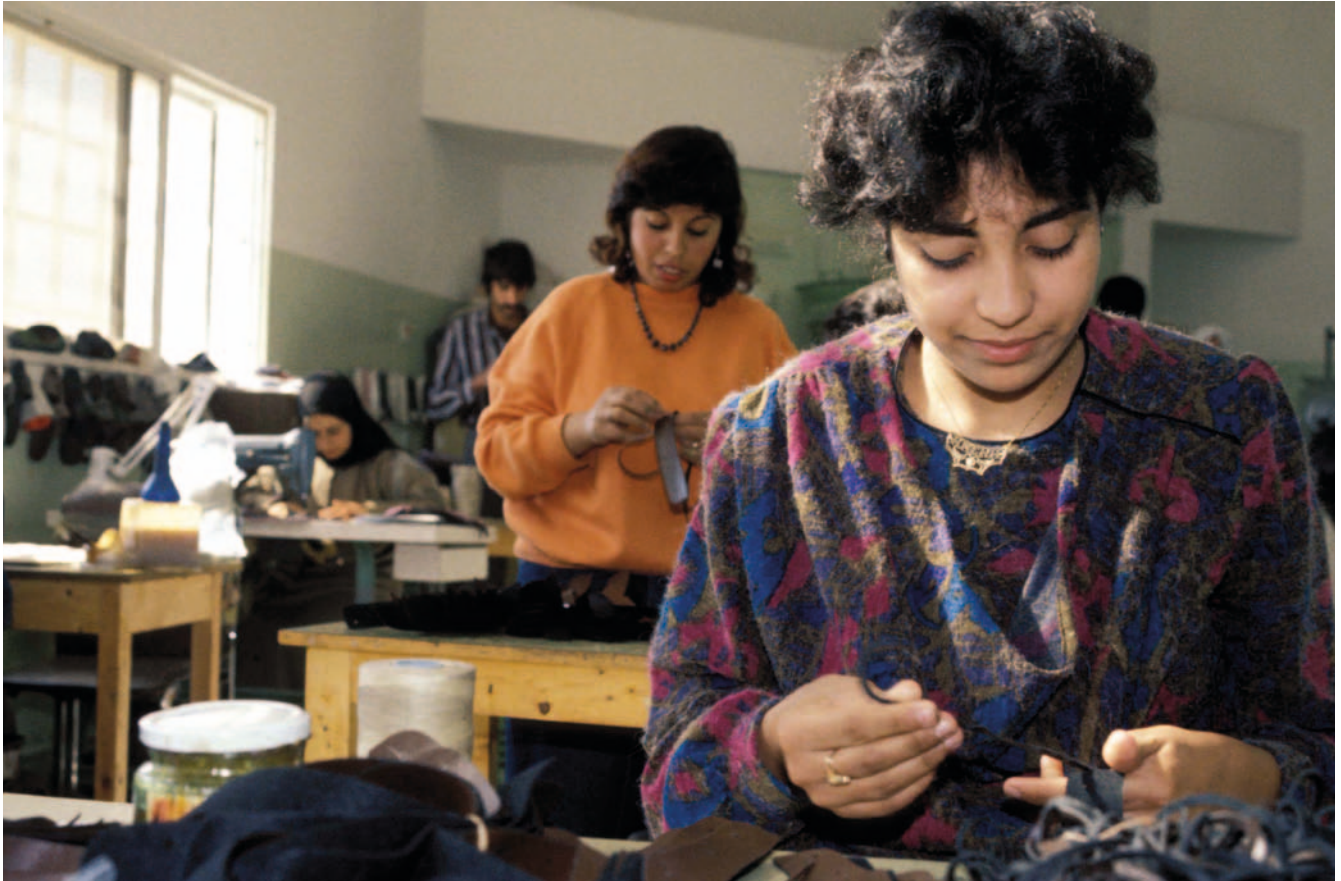
Trabajadores en una pequeña fábrica de calzado, Jordania.