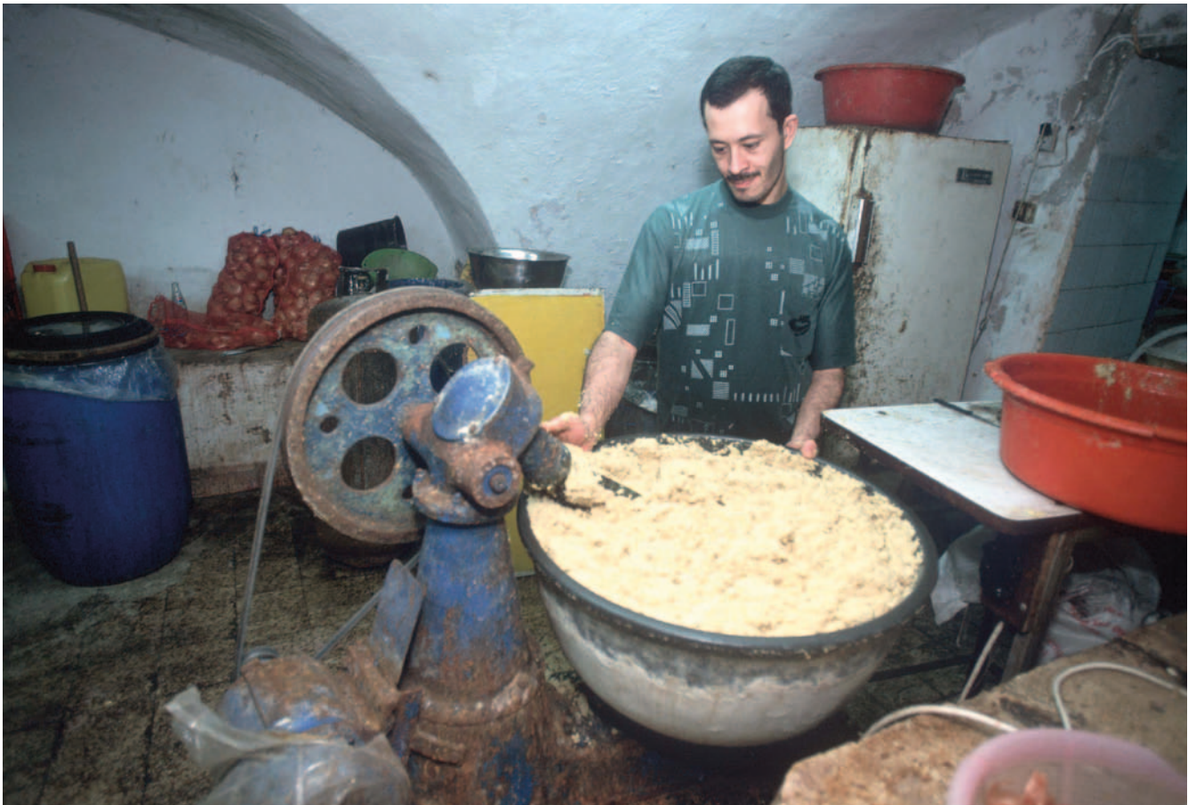
Panadería casera en el zoco de Saida, Líbano.